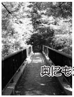
奥にも道が続いているようだ