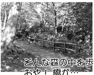
そんな森の中を歩いてみると、 おや！橋が…