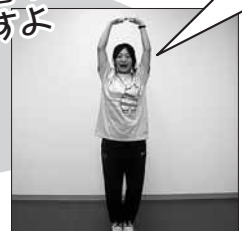
頭の上で輪をつくり、大きな声で