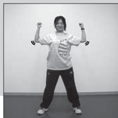
力こぶしをつくら