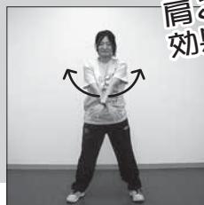
内回りで大きく腕を回して