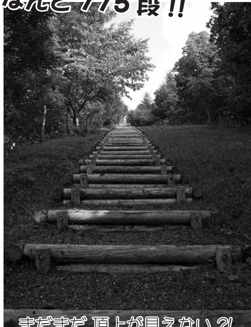
まだまだ頂上が見えない？！