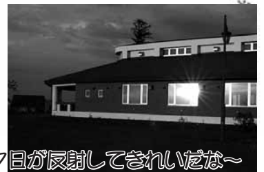
夕日が反射してきれいだな～