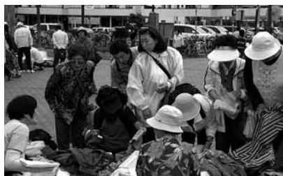
昨年のリサイクルマーケットでは、多くの方が品物選びを楽しみました。