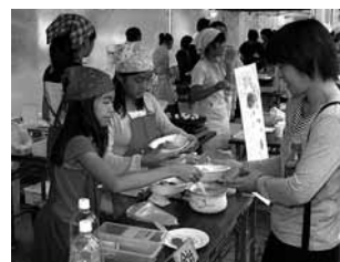
子どもたちは、調理や接客などに苦労しながらも楽しんでいました。(昨年の様子)

会場 ぷらっとパーク(4西2) 問合先 キッズ・ベンチャー実行委員会事務局 (岩見沢青年会議所内 1西2) ☎23局3964