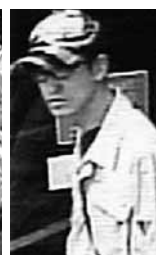
美唄の事件の犯人