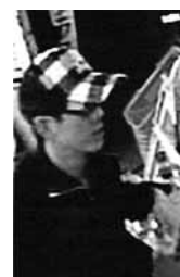
岩見沢の事件の犯人

連絡先 岩見沢警察署(10東2) ☎22局0110 この情報は8月18日(水)現在のものです。