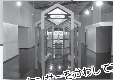
センサーをかわしてゴールへ。