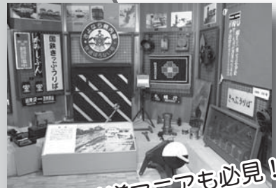
鉄道マニアも必見!