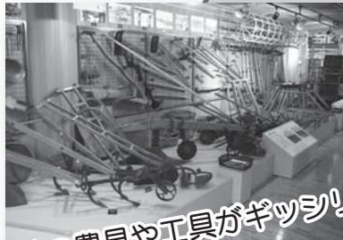
昔の農具や工具がギッシリ。