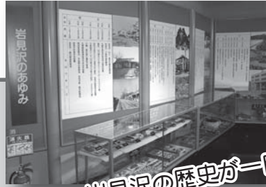
岩見沢の歴史が一目で。