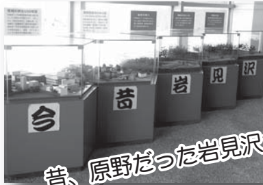
昔、原野だった岩見沢が…

ここでは、明治初期の開拓時代からのまちの様子がわかる道具や模型などを展示し、当時の生活や風俗を紹介しています。また、科学体験やプラネタリウム観覧ができるほか、色々な体験や工作のイベントも数多く開催しています。