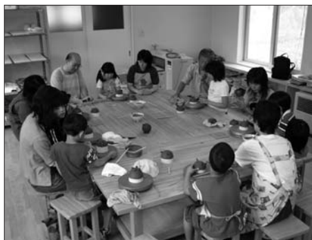
教室工房は、大人から子どもまで参加できる陶芸教室が行われます