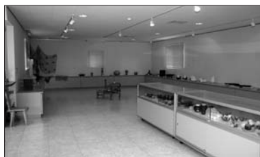
個性豊かな木工作品やガラス工芸品等が展示されているギャラリー