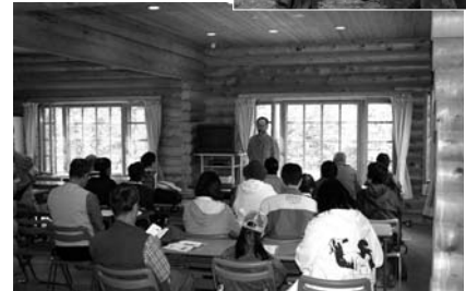
休憩所や学習会が行なわれるスペースを備えています