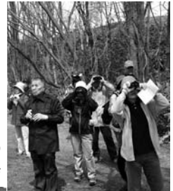
学習会後の 野鳥観察会