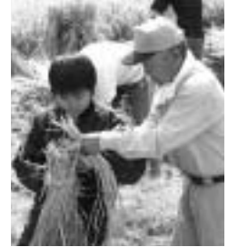
子どもたちが授業で稲作のすべてを体験できる学習田