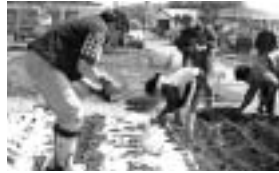
家族連れで花や畑づくりが楽しめます