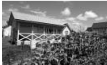
ラウベ(小屋)付の農園 別荘気分で滞在できます

施設内には滞在型と日帰り型の市民農園をはじめ、自然観察の森や体験農園、米づくりを知るための学習田のほか、農産物の加工研究ができる農産加工室や調理実習室もあり、農業体験を通して人と自然のふれあいを深めることができます。