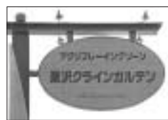
← この看板が目印です

場所 岩見沢市栗沢町由良 563 交通 中央バス長岩線・三川線・栗山線・夕張線「由良中央」下車徒歩 20分 車の場合は、JR 岩見沢駅から約 25 分、JR 栗沢駅からは約 7 分 連絡先 ☎ 34 局 2150 ☒ 34 局 2151 管理棟の土里夢館は、毎週火曜日は休みます。