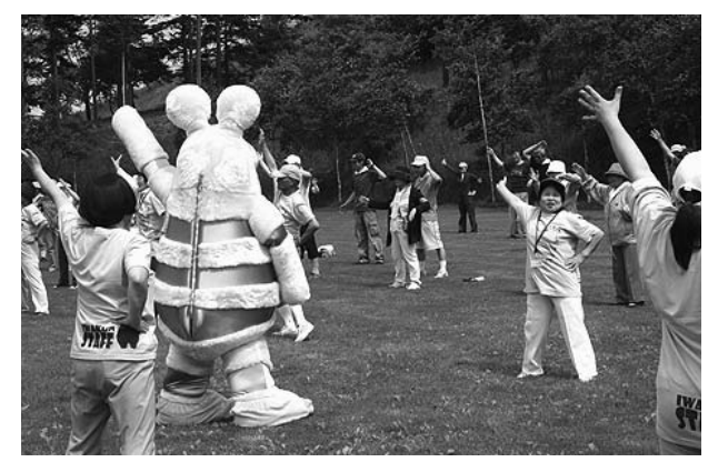
誰でも気軽にできるひゃっぴい体操

町会(自治会)やサークル、団体などで、ひゃっぴい体操指導のご希望があれば、保健師や指導員がお伺いします。また、CDやDVDの無料配布も行なっていますので、ご希望の方は岩見沢保健センターまでお越しください。 ※CDとDVDは、数に限りがあります。