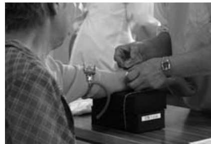
年に1度は検診を受けましょう