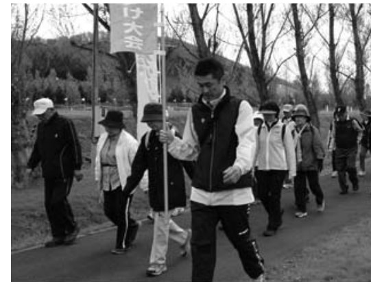
100回を超える歴史のある市民歩け歩け大会