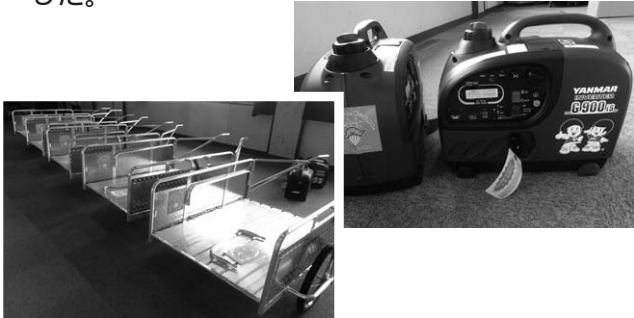
問合せ 市防災対策室

北盛地区町会自主防災対策委員会に防災資機材(発電機やリヤカーなど、130万円)を整備しました。