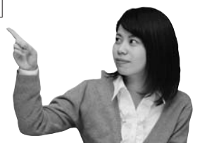
一人当たり6か月の医療費

費は、健診を受けていない人と受けている人を比べると、6か月間でこんなに違います。