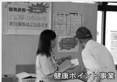
健康ポイント事業

健康寿命の延伸を目指し、市民の皆さんの健康づくりを推進するため、健康ポイント事業を始めました。