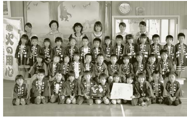
みその保育園幼年消防クラブ

長年、地域に密着した防火活動の功績が認められ、みその保育園幼年消防クラブ、月形大谷幼稚園幼年消防クラブが受章しました。