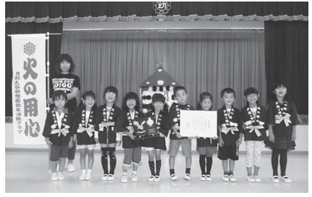
月形大谷幼稚園幼年消防クラブ