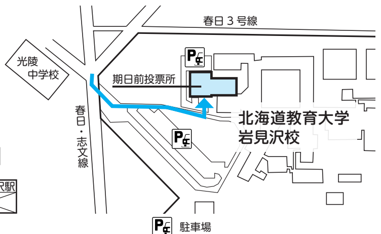
期日前投票所の場所 小会議室