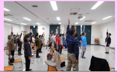
ステップアップ講座 講師の先生と楽しく！