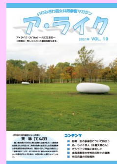
情報誌発行 取材や編集をするよ！