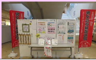
展示啓発 ポスターやグッズ展示！