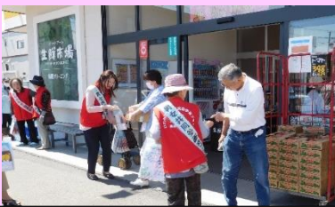
街頭啓発 啓発グッズを配布してます！