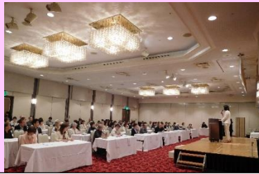
市民フォーラム 知識を深めよう！