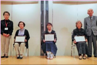
川柳コンテスト 毎年4月に募集があるよ！

いわみざわ男女共同参画プラン推進市民会議では、誰もが自分らしく生きられる男女共同参画社会の実現を目指して活動しています！ 様々なイベントの開催や情報誌を発行し、みんなで楽しく活動しています！ 会員と実行委員を大募集しています！お気軽にお問合せください！