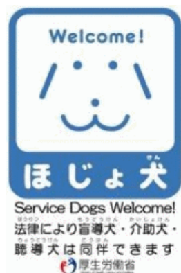
厚生労働省 (厚生労働省)