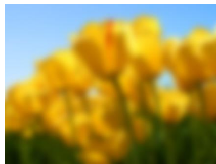
しりょくしょうがい (視力障害)