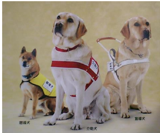
(厚生労働省作成ポスターより)