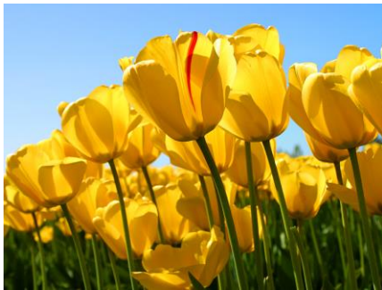
しょう (障がいのない方) かた