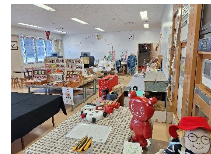
インフォメーションセンター