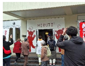
オープン時の様子