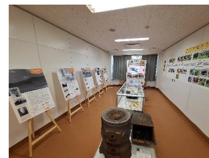
地域資料コーナー