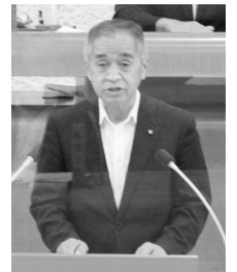
日本共産党議員団 山田 靖 廣