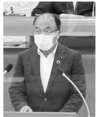
党 明 友 公 須 正 友 斉 須 正 友