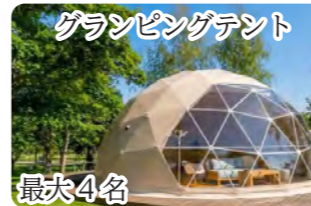
グランピングテント