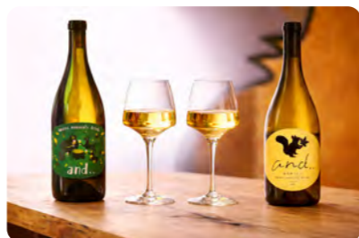
自家製ブドウオリジナルワイン

特別な夜にふさわしい、記憶に残るひとときをお楽しみいただけます。メープルロッジ産のブドウを宝水ワイナリーで醸造したオリジナルワインは、この土地の空気や風土までもが溶け込んだ一本。料理とともに味わうことで、岩見沢ならではの魅力をより深く感じていただけます。また、毛陽産のブドウ果汁を使用したクラフトビールもご用意しています。果汁のみずみずしさと個性を活かした、爽やかな香りとフルーティーな味わいが特徴です。ここでしか味わえない特別な一杯を、ぜひお楽しみください。