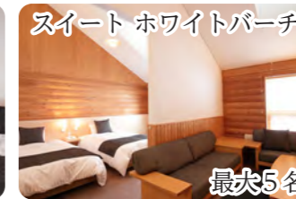
スイート ホワイトパーチ