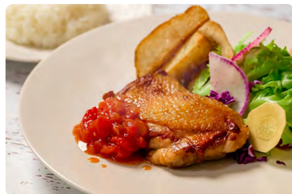
美流鶏のチキンソテーセット

地元食材を活かした季節限定メニューやデザートも充実しており、女子会やご友人とのお食事など、ちょっとしたご褒美ランチにもぴったりです。「宿泊は難しいけれど、一度訪れてみたい」という方にも気軽にメープルロッジの魅力を感じていただけます。