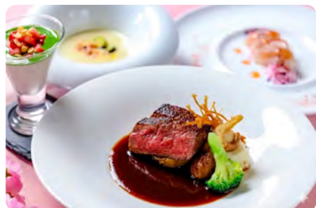
季節のフレンチ LA・SAISON

空知の恵みを味わう、創作フレンチ。四季折々の旬を大切にしながら、一皿一皿丁寧に仕上げています。見た目の美しさはもちろん、素材の魅力を最大限に引き出した味わいが特徴です。