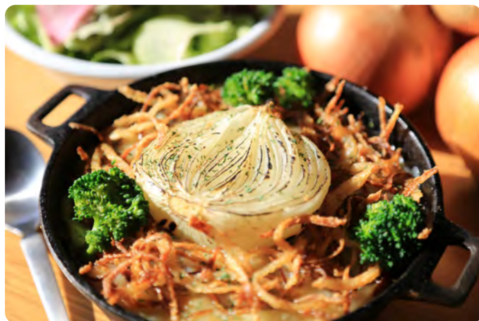
玉ねぎチーズ焼きカレー

看板メニューの「玉ねぎチーズ焼きカレー」は、テレビ番組でも紹介された人気の一皿。岩見沢産の玉ねぎの甘みと旨みを存分に引き出した、ここでしか味わえないイチオシメニューです。