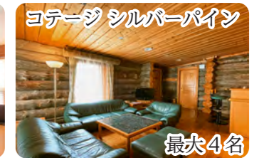
コテージ シルバーパイン