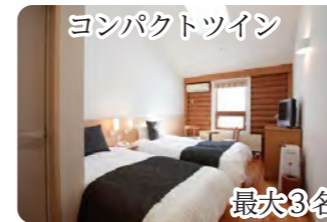
コンパクトツイン