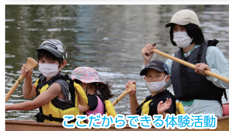
ここからできる体験活動