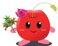
メープル小学校 キャラクター メップルちゃん

日 程 11月18日(土) 受付 午前8時40分～9時00分 日程説明 午前9時～9時15分 授業参観 午前9時25分～10時10分 説明会 午前10時25分～11時10分 申込先 11月10日(金)までに、メープル小学校 (上志文町107)へ ☎ 44-2205