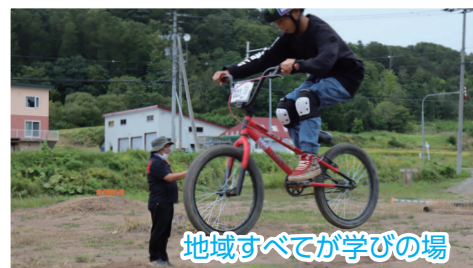
地域すべてが学びの場