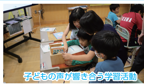
子どもの声が響き合う学習活動