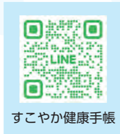
すこやか健康手帳