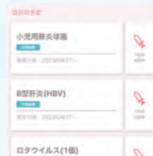
接種忘れ防止をサポート