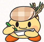
せのお ようすけ 瀬尾 洋裕

令和2年5月より地域おこし推進員として活動中 毛陽町にBMX(競技用自転車)のコース、ルコチパーク、を整備。各種イベントや自転車教室の開催といった活動をしている