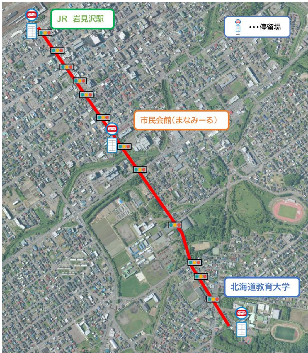
◎交通密集地域走行ルート (JR岩見沢駅⇄教育大学)