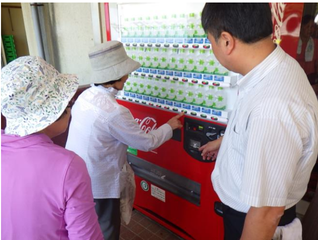
災害対応自動販売機による飲料水無料提供