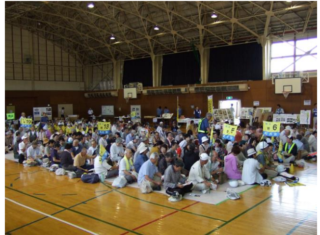
幌向小学校へ避難完了