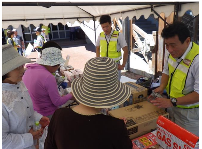
家庭での備蓄啓発