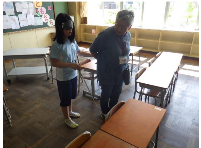
視覚障害者介護訓練