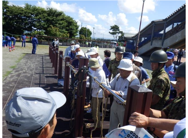
ロープワーク体験