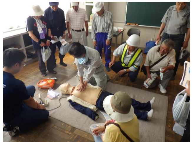
心肺蘇生法の訓練