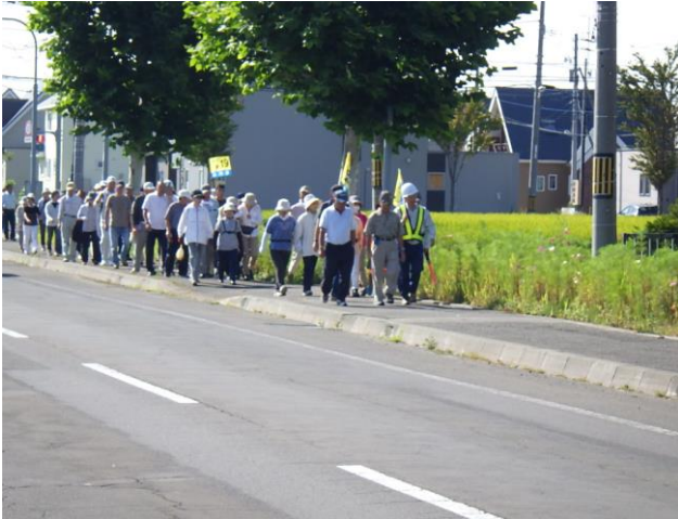
参加者の避難訓練の様子