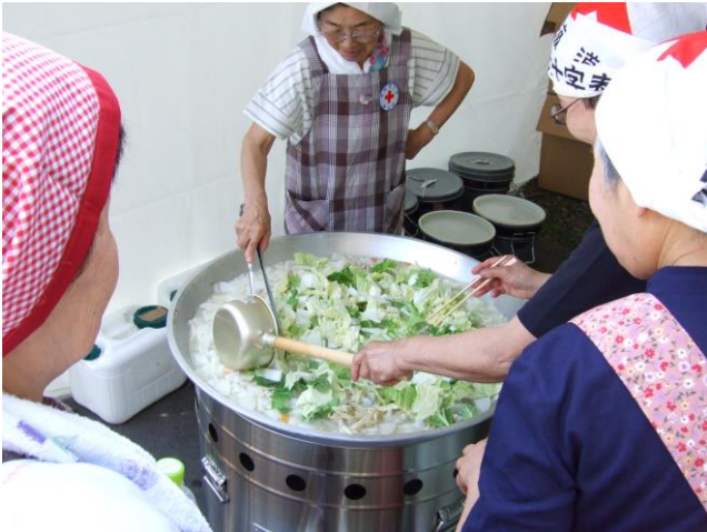
赤十字奉仕団の炊き出し